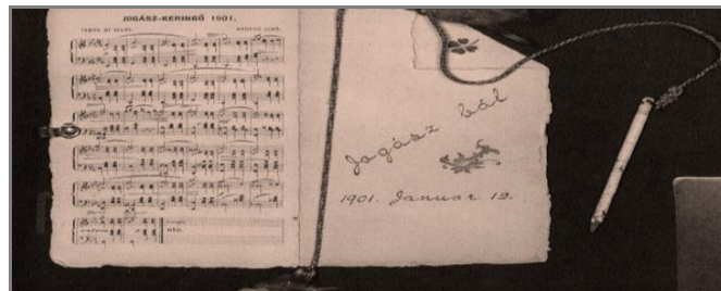
Az 1901-es jogászbál meghívója az erre az alkalomra komponált keringővel

A joghallgatók társasági élete a megszokott keretek között folyt, valami azonban volt a levegőben, ami sejtetni engedte, hogy az 1901-es esztendő legnagyobb eseménye nem a jogászbál lesz, jóllehet az est fényét még a külön erre a célra komponált jogászkerítő is emelte.