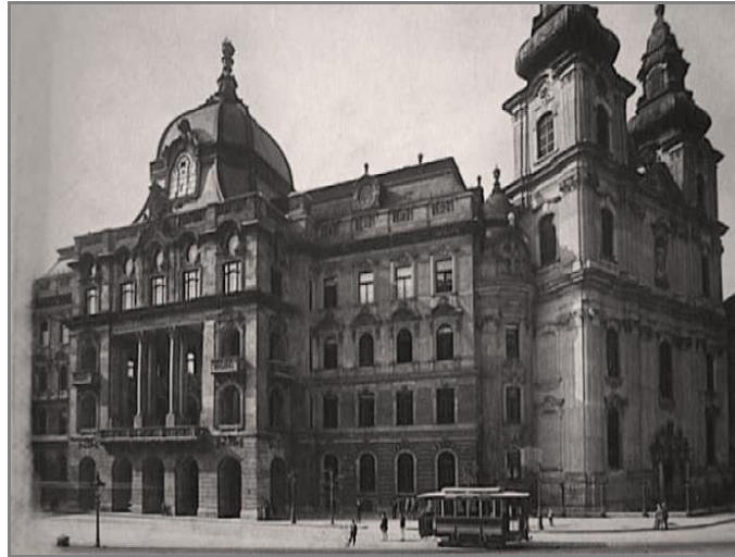
A Jogi Kar 1900-ban elkészült új épülete

Tanulmányomban a XX. század első évtizedeire emlékezünk, mely esztendőök a magyar jogelméleti gondolkodás nagy korszakának kezdetét jelentették. Felidézzük a kor hangulatát, s bemutatjuk, hogy Egyetemünk polgárai - oktatók és hallgatók – milyen szerepet játszottak a korabeli tudományos és közéleti mozgalmakban.