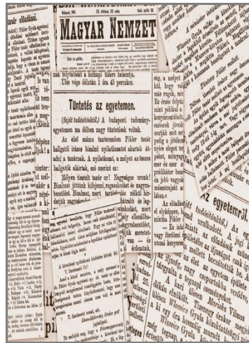
A „Pikler-ügy” a napilapokban

professzort, hogy határolódjon el a lapban megjelent állításoktól, jelentse ki, hogy azok nem az ő tanításai. Pikler nem ült föl a provokációnak. 2