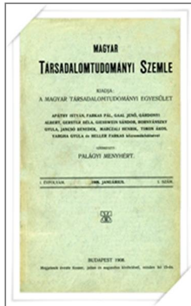
A Magyar Társadalomtudományi Szemle első kiadása

Az Egyesület megalakulásának körülményeiről és céljairól így számol be a Neutralis álnevű szerző: „A destruktív törekvések (...) kitűnő tudományos köntösben kínálták magukat. Az izgató demagógia sociologiai tolvajnyelvet használt. A magyar közönség becsületese, haladnivágyó rétegei megdöbbenve nézték ezeket a jelenségeket, és kételkedni kezdtek, hogy vajon mi a nagyobb veszedelem: a régi maradiság-e vagy ez az újító szellem? (...) A Magyar Társadalomtudományi Egyesület azoknak a szervezete, kik e tudományt magáért a tudományért művelik, a kik a társadalom törvényei és a nemzeti fejlődés között nem látnak ellentétet.” 34